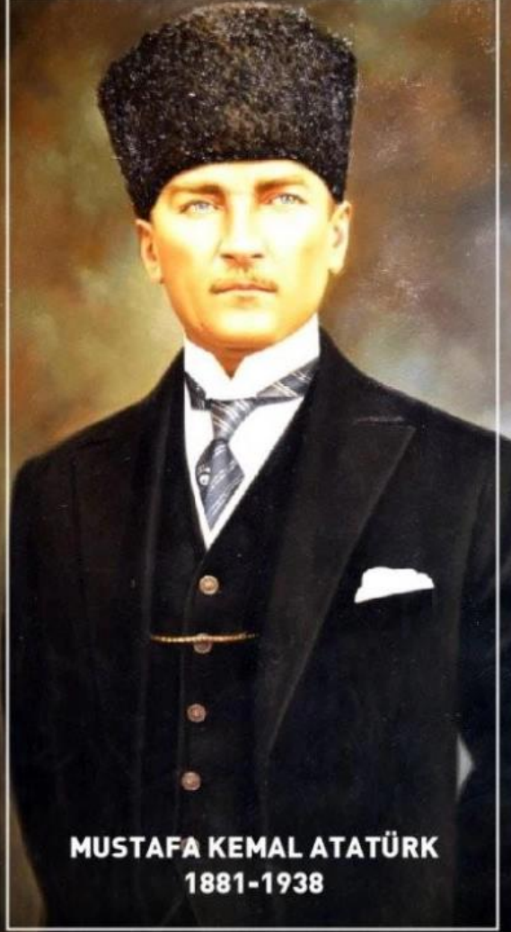
MUSTAFA KEMAL ATATÜRK 1881-1938